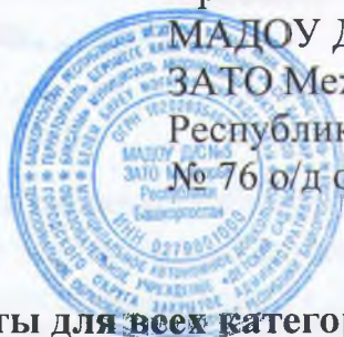
График работы для всех категорий работников МАДОУ Д/С № 5 ЗАТО Межгорье Республики Башкортостан

Нормальная продолжительность рабочего времени в организации не должна превышать 40 часов в неделю. Для педагогических работников устанавливается продолжительность рабочего времени 36 часов в неделю.